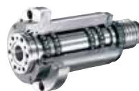
スピンドルユニット